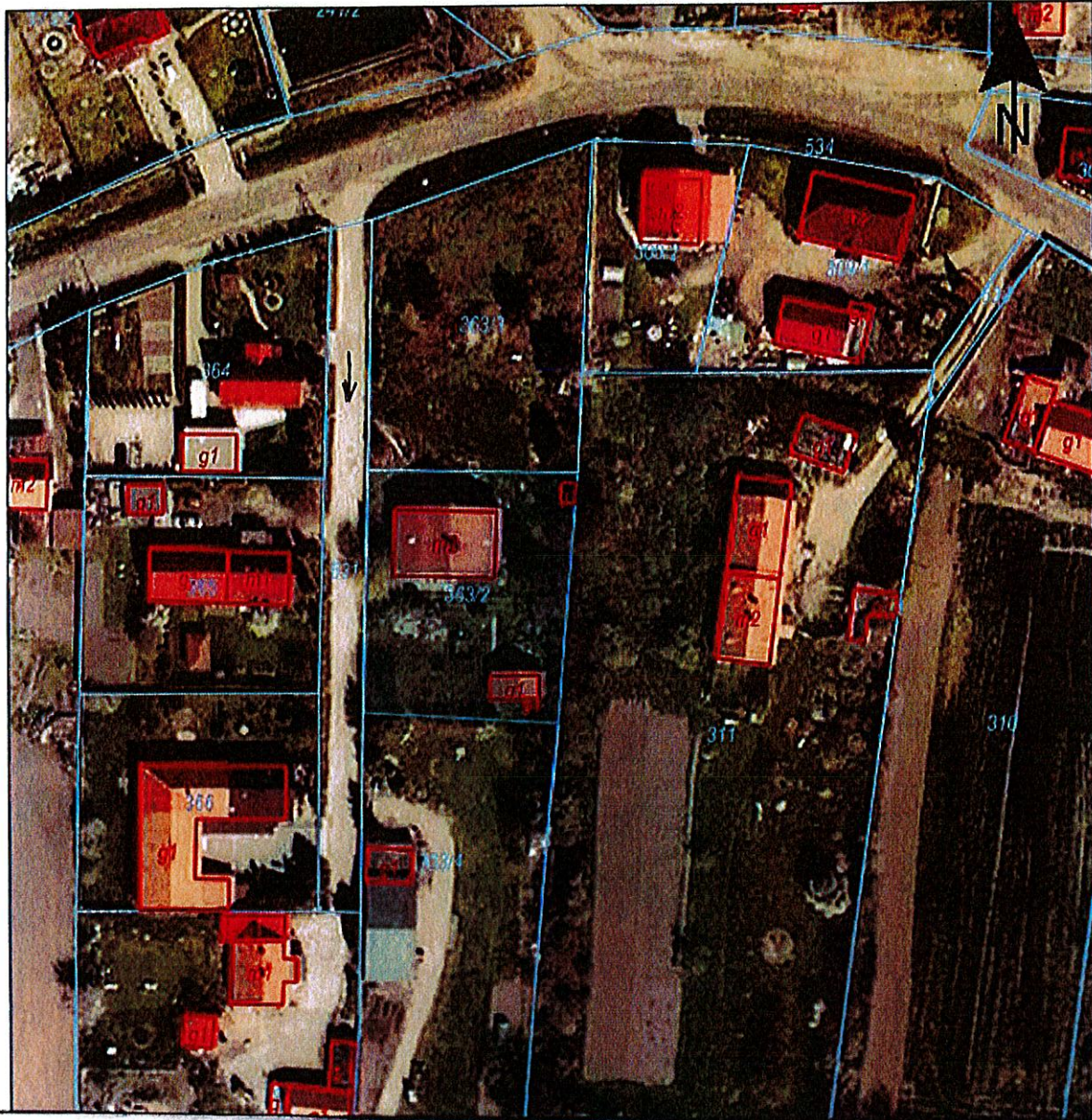
Załącznik nr 2.